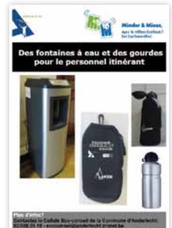
Supports de communication de l'EcoTeam d'Anderlecht